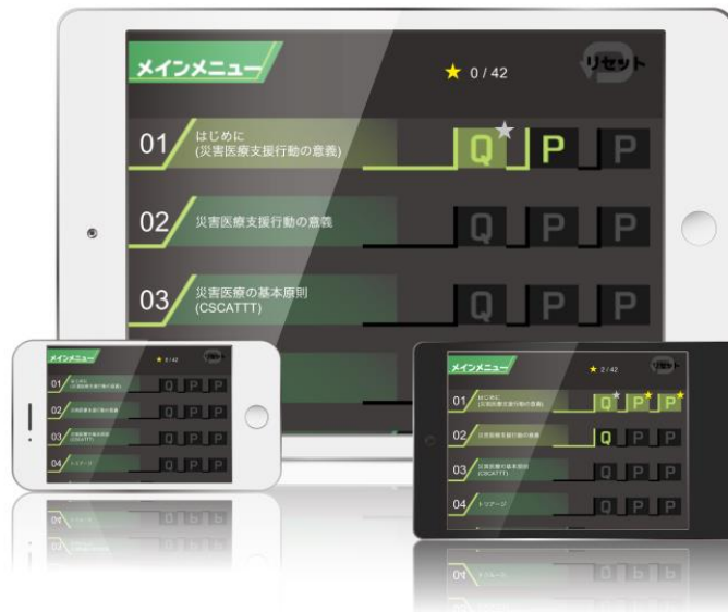
災害医療タッチ：インタラクティブな教科書（iOS と Android 用）