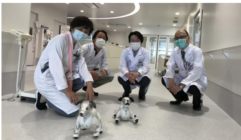
当院無菌室エリアの様子と aibo